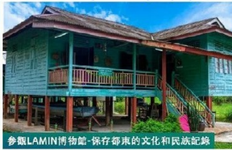
參觀LAMIN博物館-保存都東的文化和民族記錄