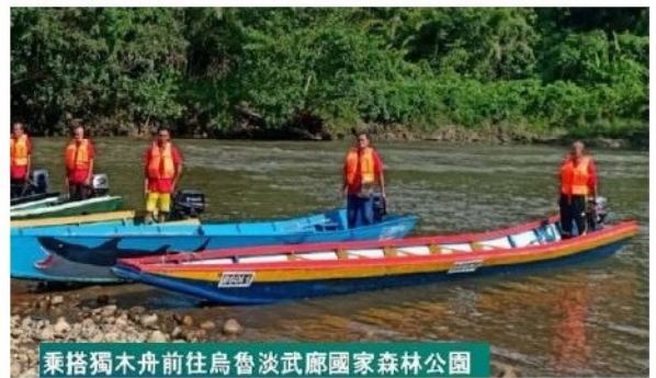
乘搭獨木舟前往烏魯淡武廊國家森林公園

早餐後，前往【淡武廊國家公園】 - 位於汶萊最東部的淡布隆區，這片佔地 50,000 公頃的未受干擾的熱帶雨林延伸到南部的大部分地區，擁有豐富的生物資源。從市區驅車穿過東南亞最長的蘇丹奧瑪阿里賽佛丁橋樑，然後驅車 30 分鐘前往巴當都里碼頭。從這裡將搭乘由當地經驗豐富的【船夫掌舵傳統的伊班民族的長舟(Temuai)，往上流前進前往【烏魯淡武廊國家森林公園】。沿途欣賞布滿河床的渾圓鵝卵石，色彩繽紛的蝴蝶飛舞在樹林間，這裡是生物多樣化的最佳例證，曾有位昆蟲學家在一棵樹山發現了 400 多種的不同昆蟲哦！抵達國家森林公園總部，身份登記後開始徒步上山，探訪天蓬走道以及瞭望塔挑戰【天空步道】，純淨藍天白雲在秘境如天堂般的天空之鏡美麗景色，汶萊美景網紅必到之處。(若遇到下雨氣候不佳則取消)。隨後再次乘坐長舟回到碼頭。驅車沿途隨後【參觀野生動物康復中心】。午餐後驅車前往參觀【邦卡鎮(Bangar Town)】到最著名的-壁畫必打卡景點。前往【SUPERTREE 步行街】參觀裝置藝術，傘狀的造型如今成為了淡武廊鎮的新地標行程結束後，驅車返回市區。晚餐後返回酒店休息。