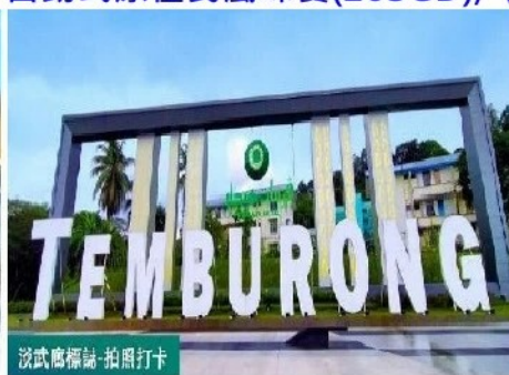
淡武廊標誌-拍照打卡