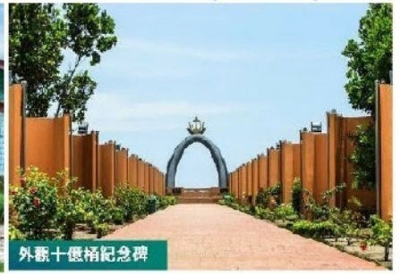
外觀十億桶紀念碑